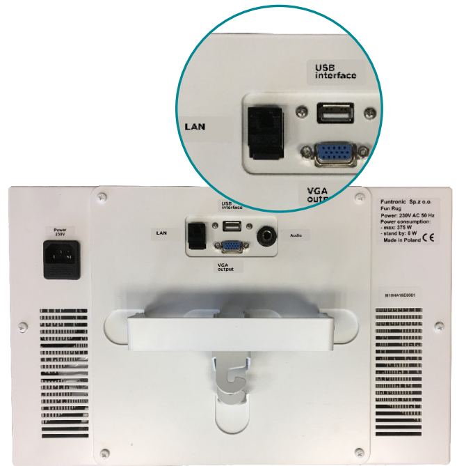
Oberseite der Tovertafel

Indem Sie Ihre Tovertafel regelmäßig updaten, stellen Sie sicher, dass Ihre Tovertafel mit den neuesten Verbesserungen an Spielen und Software aktualisiert ist. Um ein Update vornehmen zu können, muss die Tovertafel mit dem Internet verbunden sein. Sie haben zwei Möglichkeiten die Tovertafel mit dem Internet zu verbinden: mit dem WLAN-Dongle oder mit einem Internet-Kabel, das Sie in das Gerät stecken.